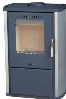
KRBOVÁ KAMNA COLMAR